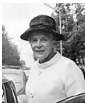
Alva Myrdal (Uppsala, Suècia, 1902 Estocolm, Suècia, 1986) PREMI NOBEL DE LA PAU 1982