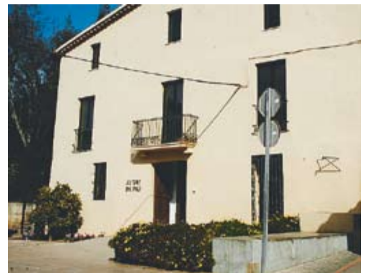
© Antic obrador d'Antoni Alberola, els actuals jutjats de Pau