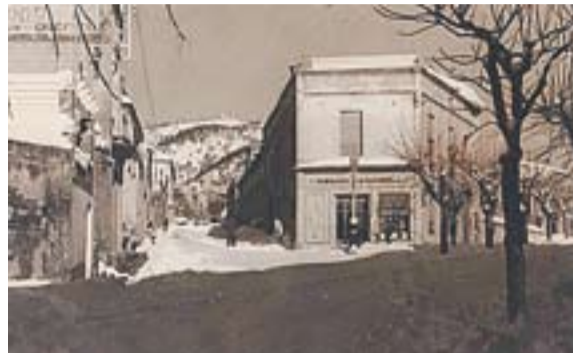
© Façana de l'edifici on Emili Campas tenia situat el seu obrador