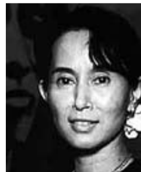
Aung San Suu Kyi (Rangun, Birmània, 1945) PREMI NOBEL DE LA PAU 1991