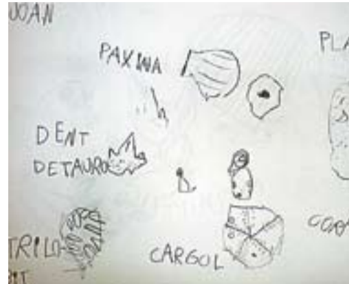
Dibuix i escriptura lliure d'alguns dels fòssils que més ens han interessat.