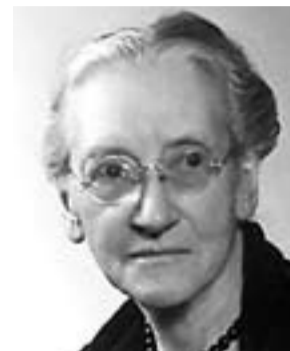
Emily Greene Balch (Boston, EE. UU. 1867 - 1961) PREMI NOBEL DE LA PAU 1946