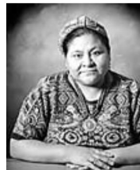
Rigoberta Menchú (Usulután, Guatemala, 1959) PREMI NOBEL DE LA PAU 1992