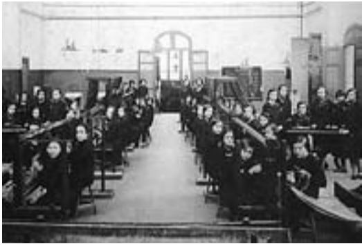
© Secció de passadores de peces de l'Escola Industrial de Sabadell. 1930

Els salaris de les cosidores, esberradores i escutiadores no es va reglamentar fins l'any 1917. Fins llavors, els fabricants es sostreien mútuament aquestes treballadores amb salaris més elevats. El 1917 es fixaren els salaris màxims en 16, 12, i 12 pessetes (cosidores, esberradores i escutiadores) que, amb l'1,50 pessetes d'augment transitori per l'augment de les subsistències pujaven a 17,50, 13,50 i 13,50 respectivament. També es fixà el preu de 2,50 pessetes l'hora per a les cosidores de fora de la fàbrica, així com la possibilitat de donar peces a preu fet. 2 És a dir: el treball a domicili es pagava a la meitat de l'establert a la fàbrica. 3