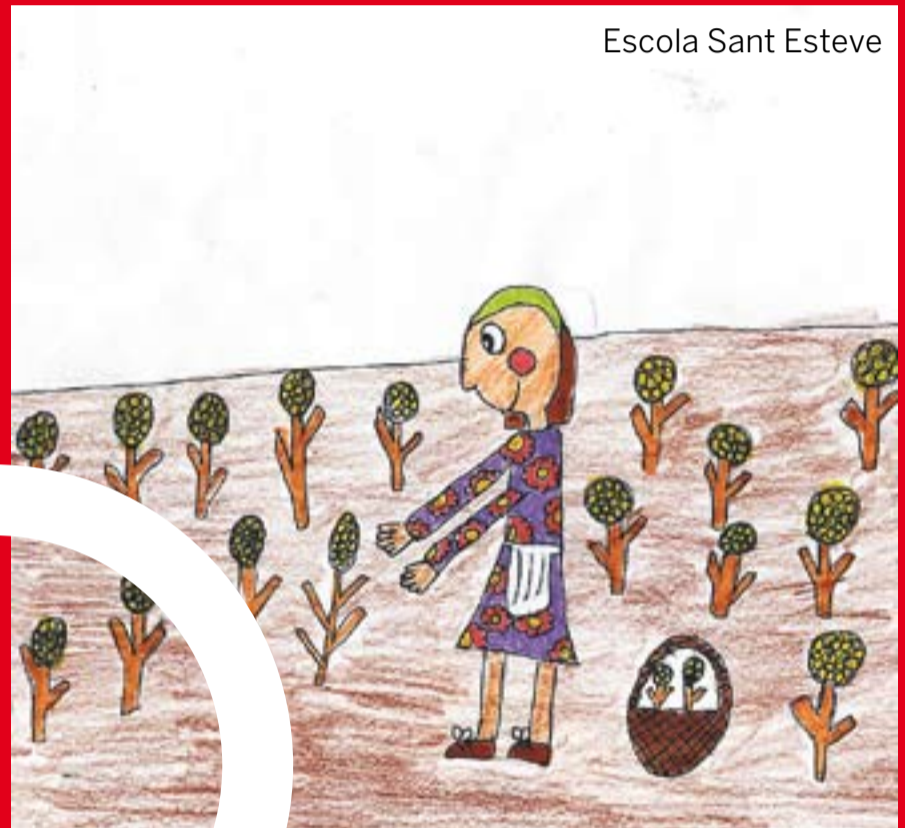
Escola Sant Esteve