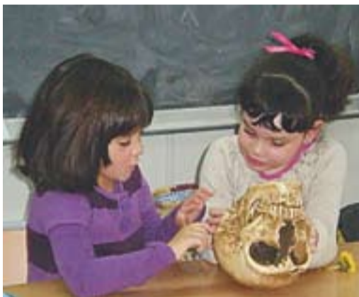
Ens hem entusiasmat tant amb els fòssils i les restes humanes que hem decidit aprendre sobre el treball que realitzen els Paleontòlegs/es.