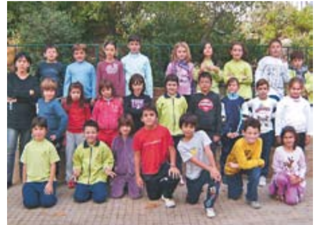
© 3r de primària (Grup A)