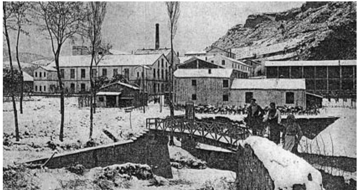
© Fàbrica del Molí l'any 1911 era la fàbrica d'acabats de l'empresa Tolrà.

Finalment, hem de dir que a la gent no sembla importar-li gaire que hagin desaparegut molts dels oficis que feien les dones, ja que actualment en fan d'altres més tranquils, còmodes i moderns.