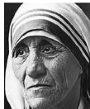
Teresa de Calcuta (Skopje, Macedònia, 1910 Calcuta, Índia 1997) PREMI NOBEL DE LA PAU 1979