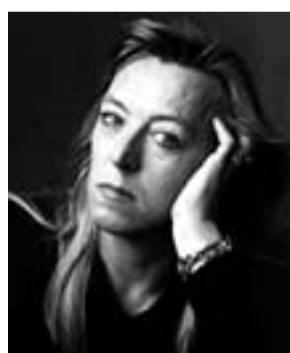
Jody Williams (Putney, Vermont, EE. UU. 1950) PREMI NOBEL DE LA PAU 1997