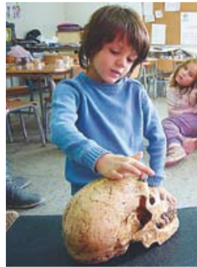
Ens expliquem allò que observem.