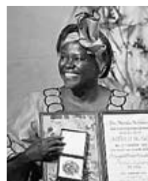
Wangari Maathai (Nyeri, Kenya, 1940) PREMI NOBEL DE LA PAU 2004