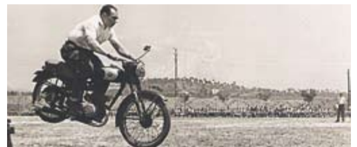
© Moto Derbi de 150 cc.