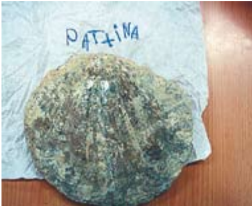
Aportació, per part de les famílies, de fòssils i de material que ens ajuda a investigar i diferenciar el que és i el que no és un fòssil.