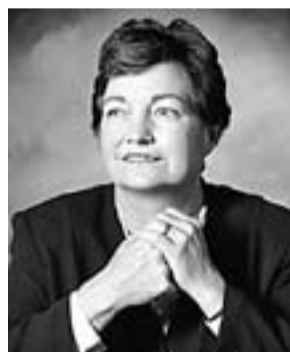
Mairead Corrigan (Belfast, Irlanda del Nord 1944) PREMI NOBEL DE LA PAU 1976