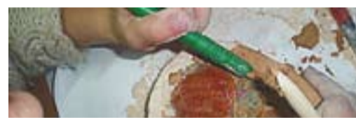
També hem jugat a paleontòlegs/es buscant fòssils en una quadrícula, utilitzant eines com ho fan ells/es i treballant en equip.