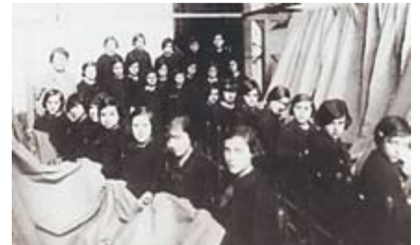
© Secció de cosidors de peces de l'Escola Industrial de Sabadell. 1930

A inicis de segle XX, Castellar del Vallès formava part del partit judicial de Sabadell, junt amb un seguit de pobles més que l'envoltaven: Barberà, Polinyà, Sentmenat, Ripollet, Sant Cugat... Mentre que la indústria llanera era la predominant a Sabadell ciutat, amb un 90% de la mà d'obra ocupada a la indústria tèxtil i només amb un 10% dedicada al cotó, als pobles de la seva demarcació passava justament al contrari, tot predominant la indústria cotonera gairebé en un cent per cent 1 .