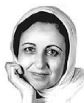
Shirin Ebadi (Hamadan, Iran, 1947) PREMI NOBEL DE LA PAU 2003