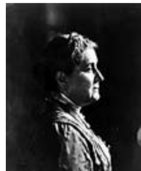
Jane Addams (Illinois, EE. UU. 1860 Chicago, EE. UU. 1935) PREMI NOBEL DE LA PAU 1931