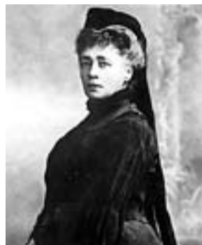
Bertha von Suttner (Praga, Txecoslovàquia, 1843 Viena, Àustria, 1914) PREMI NOBEL DE LA PAU 1905