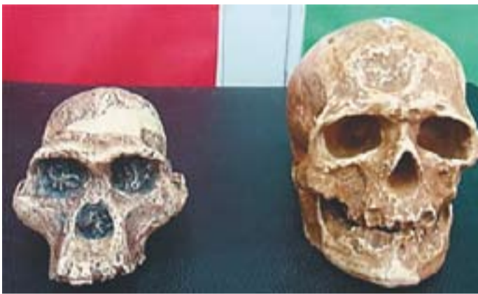
Comparació d'una reproducció de crani d'Australopithecus amb la d'un crani d'home sapiens sapiens.