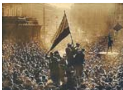
© Un petit grup de republicans enmig de la gent que està a favor de la dictadura

A través de la documentació recollida sobre la seva persona, l'alumnat de 5è i 6è hem elaborat una entrevista fictícia a qui va ser la nostra primera directora.