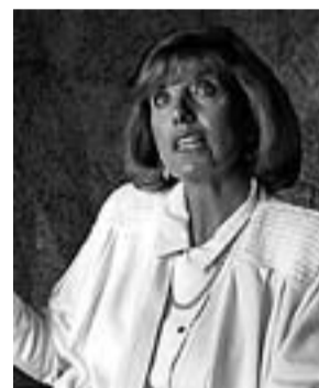
Betty Williams (Belfast, Irlanda del Nord 1943) PREMI NOBEL DE LA PAU 1976