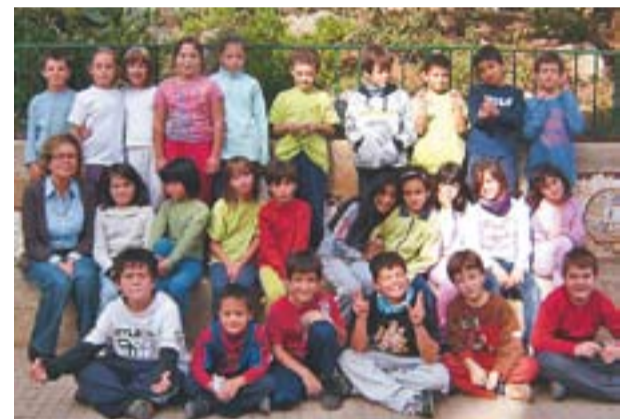
© 3r de primària (Grup B)