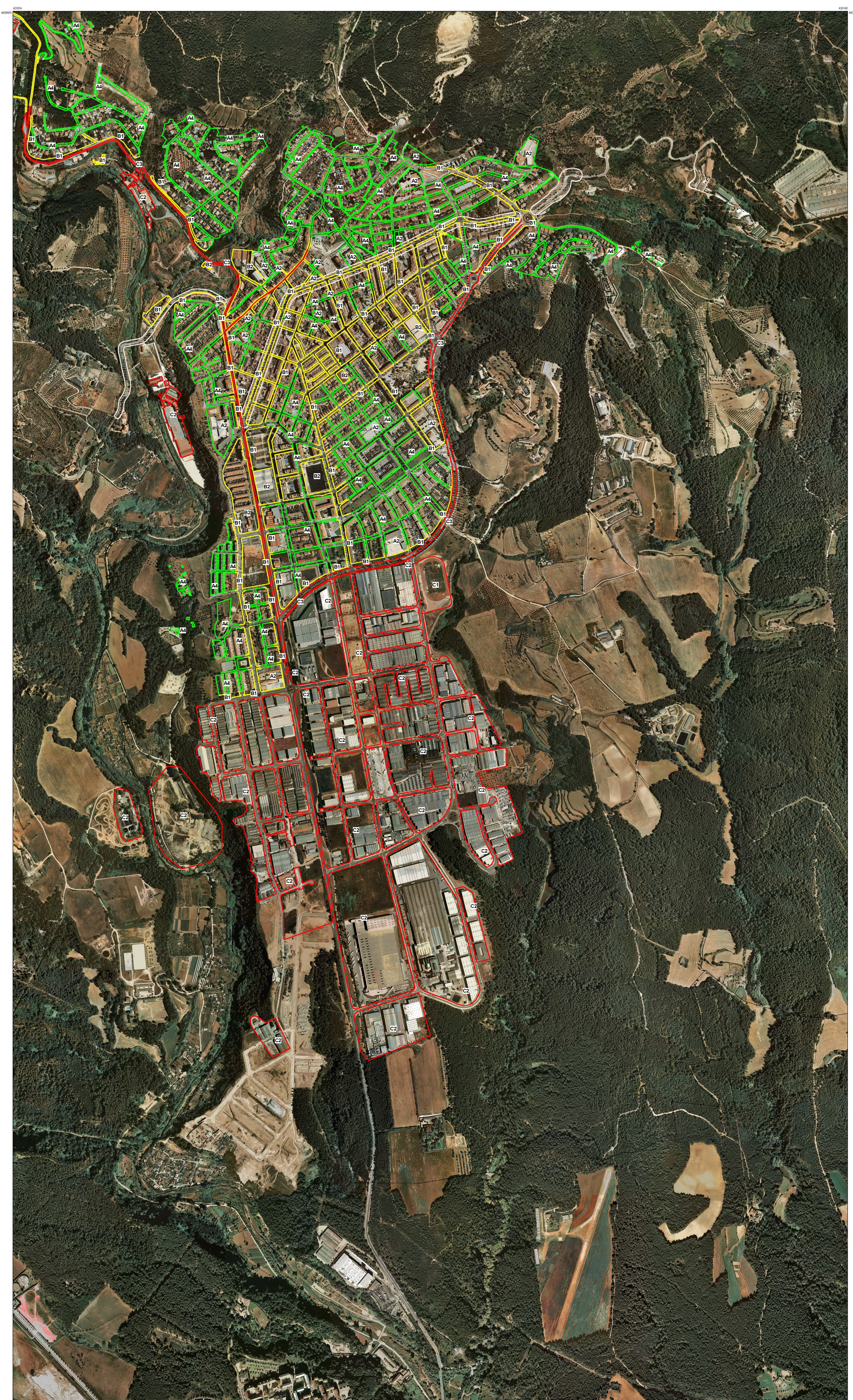
Mapa de Capacitat Acústica Zones de sensibilitat acústica i usos del sòl 2011

Municipi: CASTELLAR DEL VALLÈS Nuclis: Castellar del Vallès Els Fruïters Pla de Bruguera Can Camer