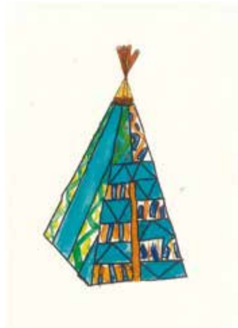
Escola Josep Gras