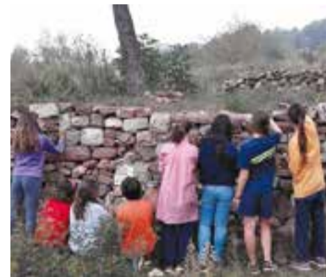
La pedra com a suport real de pintura