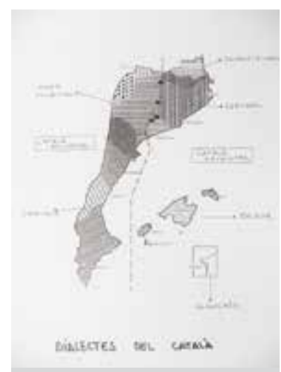
Diferents dialectes del català