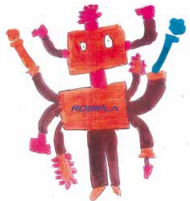
Escola Mestre Pla