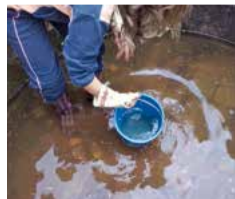
L'aigua estancada de la pluja