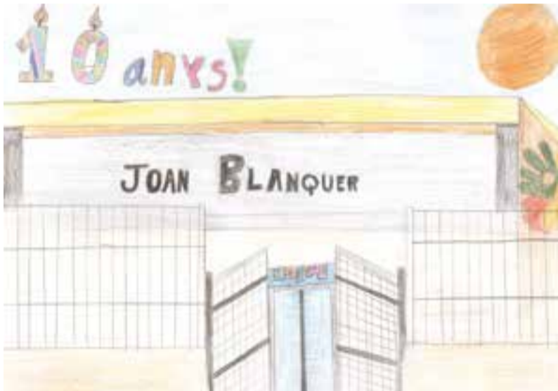
Escola Joan Blanquer