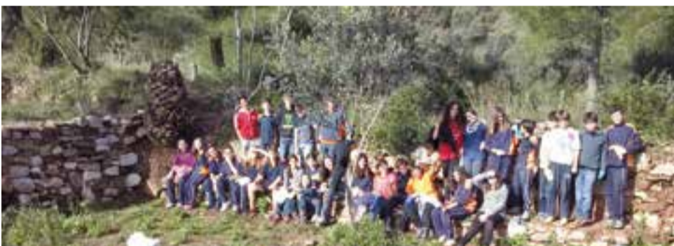
Un espai idoni on posar en pràctica aquestes propostes

A la nostra escola tenim l'ocasió i l'espai per posar en pràctica aquesta experiència utilitzant el nostre entorn immediat, i a dos nivells: l'espai de treball pròpiament dit, i en segon lloc, com a font de matèria primera.