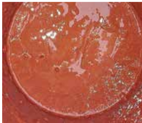
La terra del nostre entorn, un pigment

Es tracta de veure la resistència de les pintures a les condicions climatològiques amb el pas del temps. De rebot, han pogut comprovar que pintar sobre pedra, amb forma i textura irregular, no és gens fàcil. Més mèrit afegit pels artistes que ens han deixat com a llegat les obres mestres de la cova de Lascaux, a França, models que han utilitzat els alumnes en alguns casos.