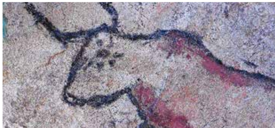
Aproximadament un mes després, amb pluges, aire i sol, aquest és l'estat

La matèria primera utilitzada la tenim ben a l'abast. L'entorn natural de l'escola ens va facilitar un fang d'una textura ideal (beneïda la pluja caiguda el dia abans!). La palla amb la qual s'ha de barrejar per consolidar l'interior del maó i el motllo per omplir de material completaven el pack necessari. Les imatges us ajudaran a veure el procés seguit.