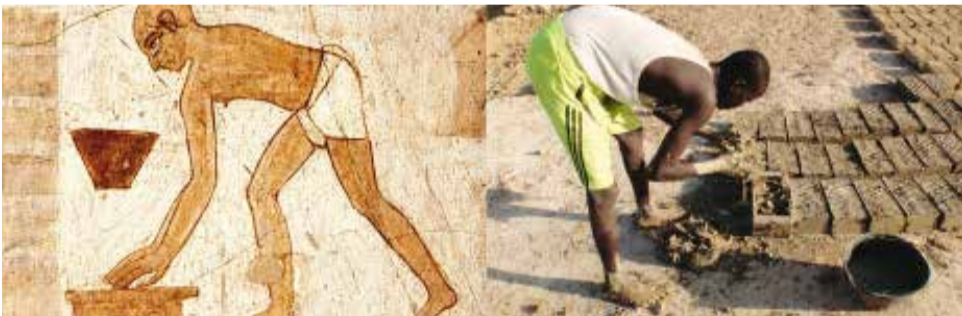
Entre les dues imatges hi ha uns 5.000 anys de diferència; entre l'acció realitzada, cap!

Però quina és la importància històrica? Podem dir que és el material de construcció més antic, amb evidències arqueològiques des del VIIè mil·lenni a.C, i avui dia encara utilitzat a gran part del món, principalment en zones poc o gens industrialitzades.