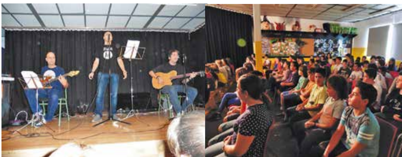
Concert versió Ovidi Montllor