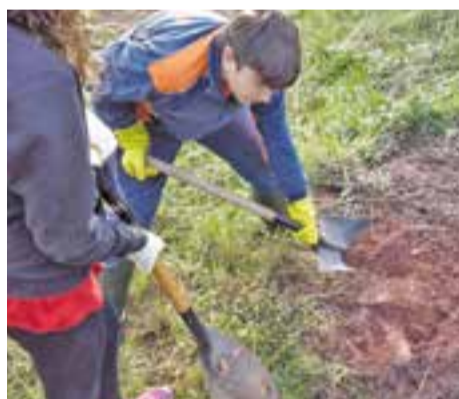
Agafant la terra

La matèria primera utilitzada la tenim ben a l'abast. L'entorn natural de l'escola ens va facilitar un fang d'una textura ideal (beneïda la pluja caiguda el dia abans!). La palla amb la qual s'ha de barrejar per consolidar l'interior del maó i el motllo per omplir de material completaven el pack necessari. Les imatges us ajudaran a veure el procés seguit.