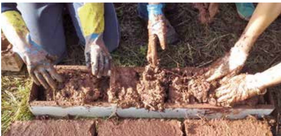
Omplint els motllos