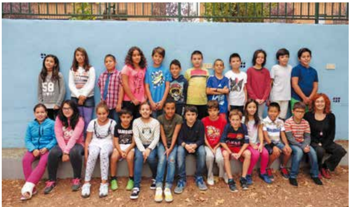
Foto grup 5è B