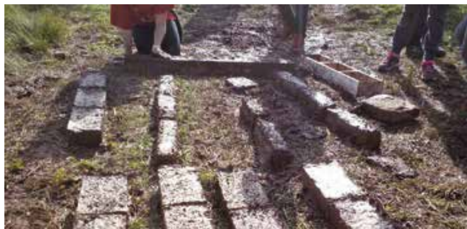
No en vam fer tants com per construir una muralla defensiva o un magatzem pel blat, però l'objectiu didàctic va quedar ben satisfet