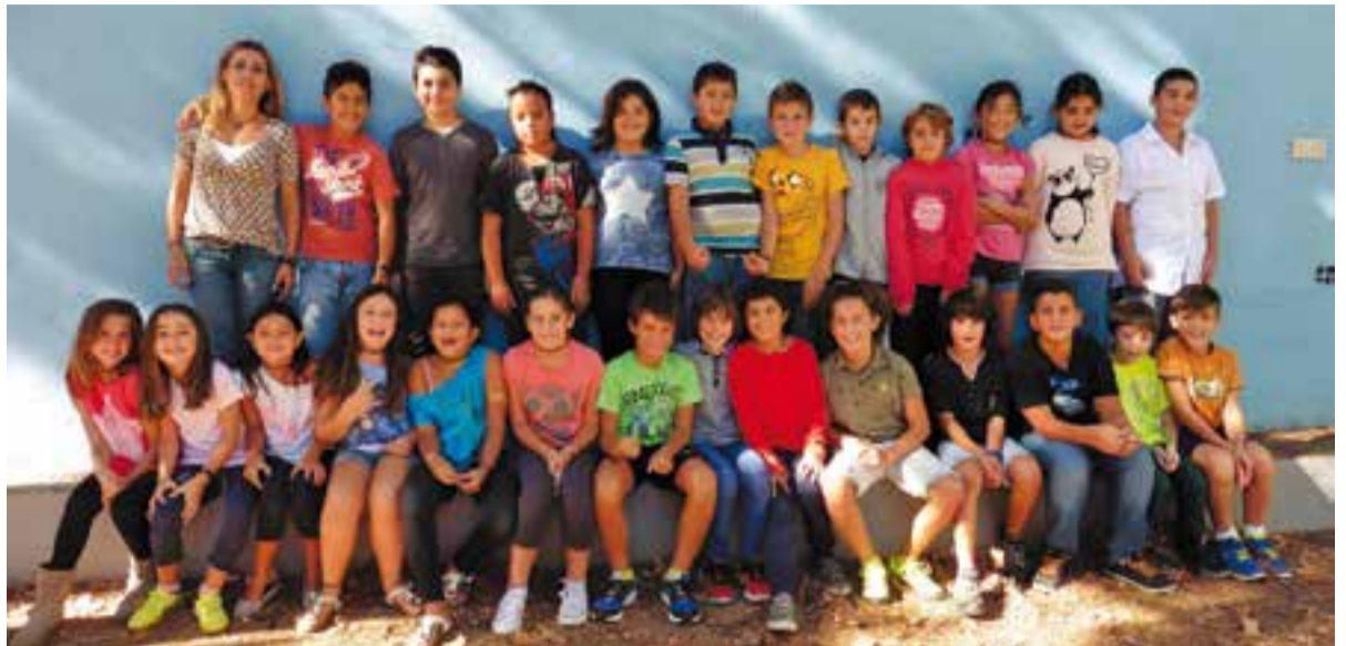
Foto grup 5è A

Hem aprofitat el Correlengua també per treballar les comarques de Catalunya i altres aspectes de la llengua catalana. Al final del projecte, vam fer un vídeo on explicàvem tot el que havíem après amb el Correlengua i, més tard, pares i mares, el van poder veure a l'escola. Si esteu interessats el trobareu en el nostre blog de cinquè de l'escola.