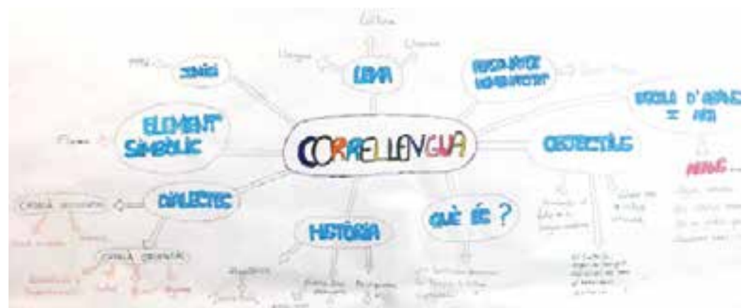
Mapa conceptual dels alumnes de 5è B