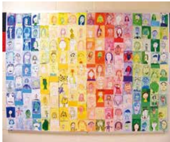
Escola Sant Esteve