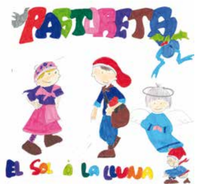
Escola El Sol i La Lluna