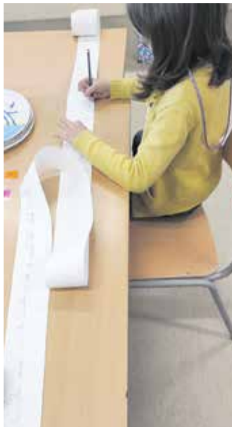
© Fem un "rotllo" de conte.

Reflexionem sobre la funcionalitat i el valor de l'escriptura.