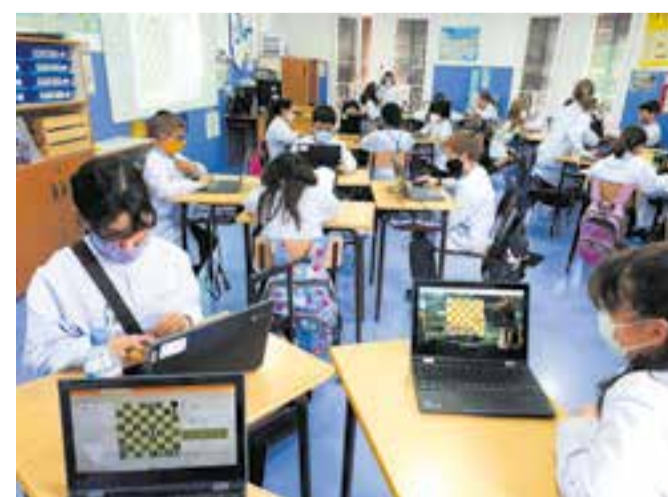
© Jugant un torneig amb tots els alumnes de la classe.

Els escacs són com una metàfora de la vida, totes les peces tenen les seves funcions i limitacions, aquestes es necessiten les unes a les altres, algunes peces les has de capturar pel bé comú, cal prendre decisions, si pot ser encertades, si no ho són, et serveixen per reflexionar com a experiència.