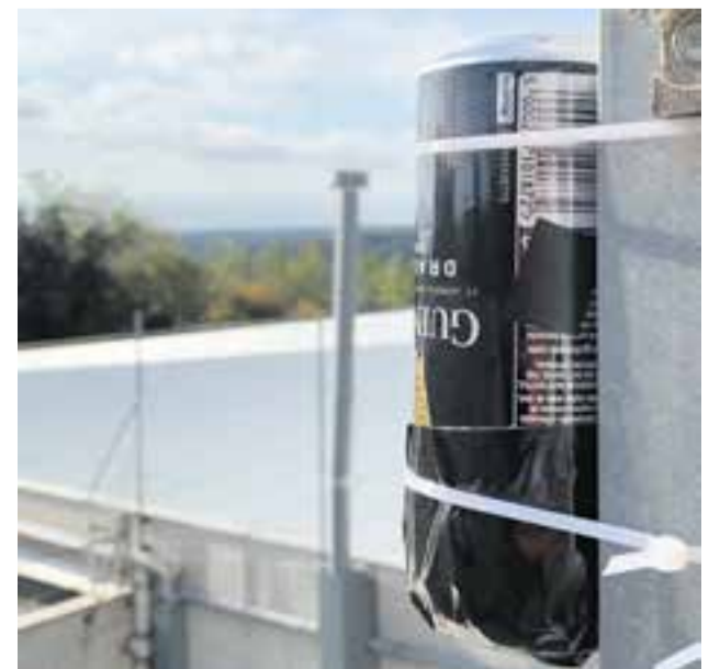
© Càmera estenoica feta amb una llauna.