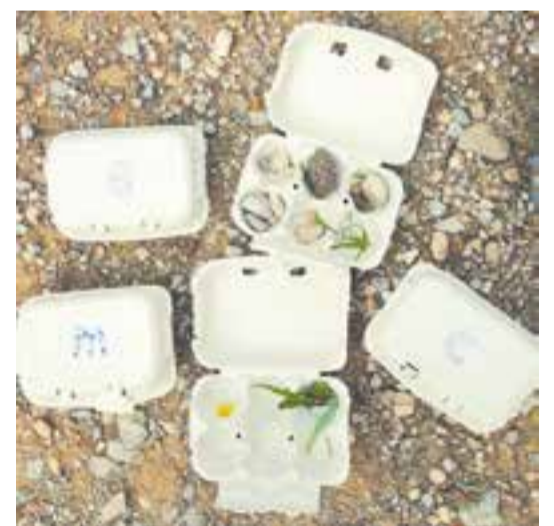
Ⓞ Des del projecte Natura, seguim amb el treball de consciència fonològica fora de l'escola. Busquem allò que comenci pel so treballat.