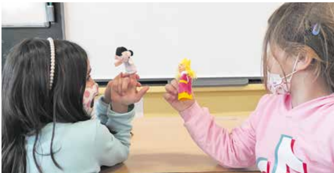
© Els titelles ens donen molt joc per expressar-nos.