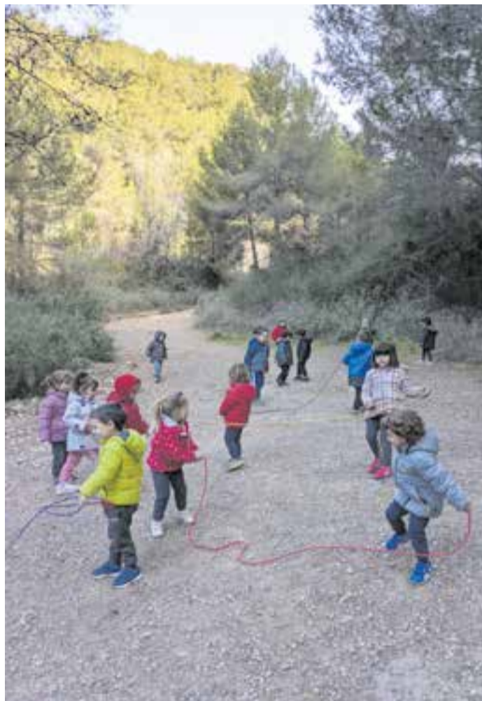
© Escalfem amb la cançó "La cuqueta amb sucre".

Cada dimecres al matí surten de l'escola i es dirigeixen cap a la muntanya, on realitzen sessions molt variades, des de recórrer un circuit simulat que són lleons, fins a fer joc lliure en què els infants aprofiten per posar a prova les possibilitats que el seu cos els ofereix saltant per les pedres, fent equilibris, construint cabanes... La natura ha passat a formar part de l'aprenentatge psicomotriu; els brinda la possibilitat d'explorar l'entorn, de conèixer-se i créixer com a éssers vius. D'aquesta pandèmia en sortirem valorant molt més el meravellós entorn natural que tenim al nostre poble.