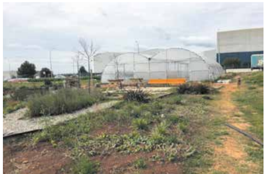
© Estat previ de l'espai.

En total s'hi ha plantat 133 plantes que només han estat regades, alguna de molt puntual, quan han mostrat necessitats de reg.