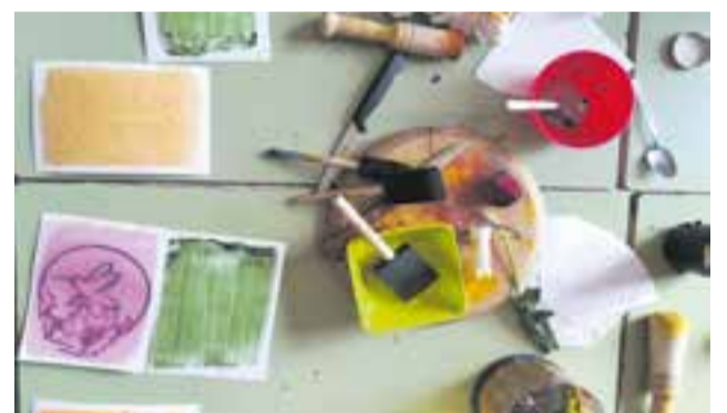
Material per realitzar una antotipia.

Amb aquesta petita investigació hem obert les portes a la fotografia experimental i a plantejar-nos altres vies de creació d'imatges més artesanals, creatives, sostenibles i fins i tot carregades de certa màgia que tenim intenció de continuar explorant i treballant d'ara en endavant.