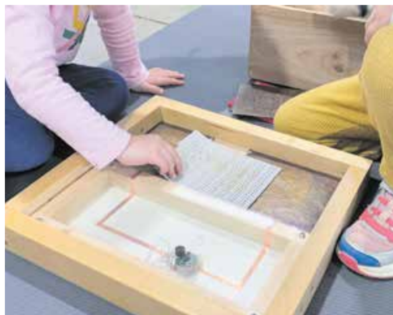
© Taller del LAB 0-6 de ciència en circulació lliure.