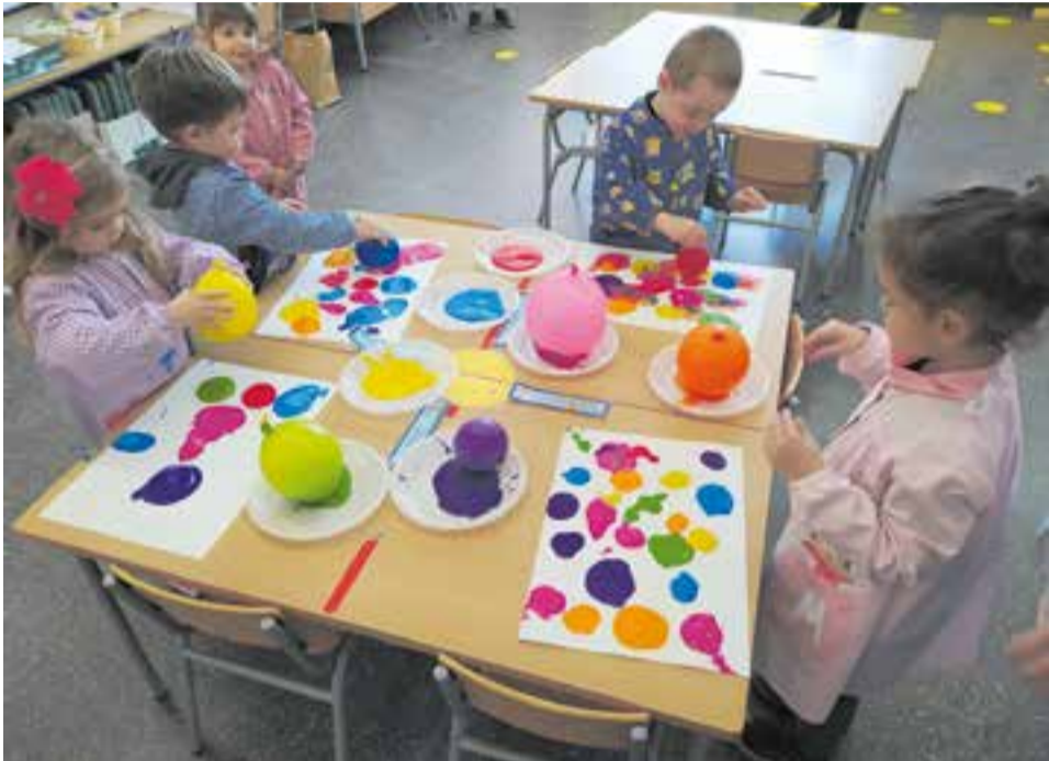
© Pintem l'alegria amb un globus a partir de música alegre.