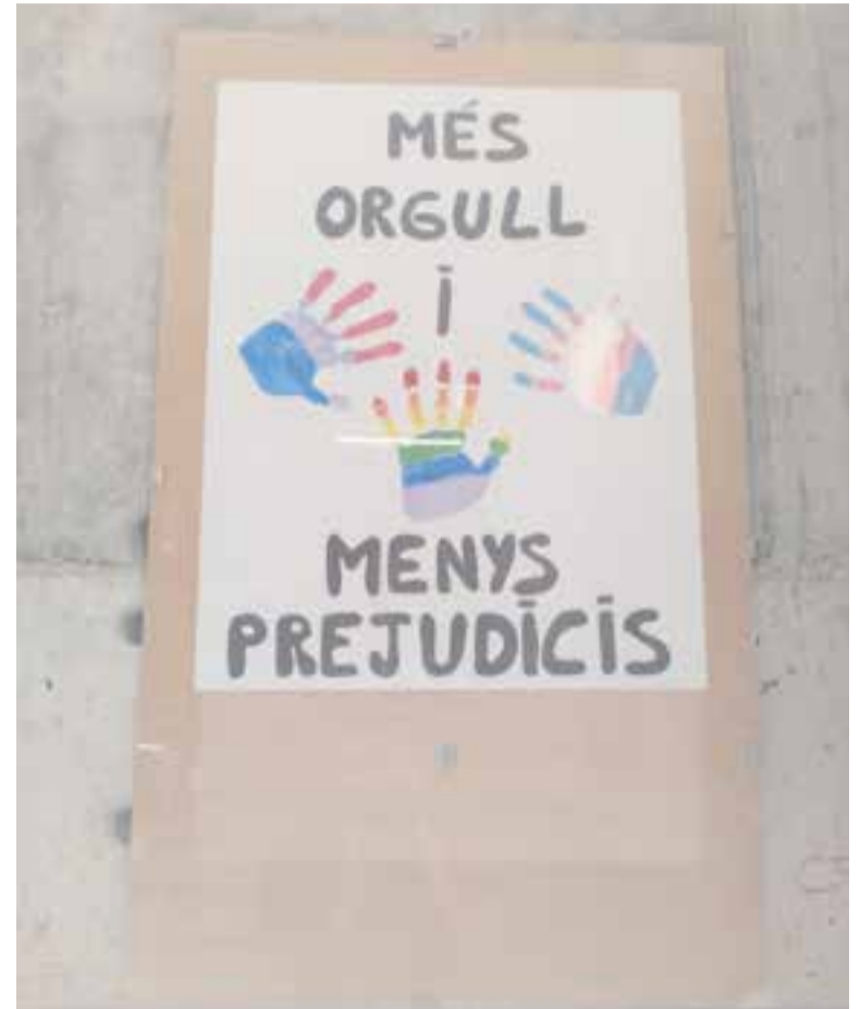
© Alguns dels plafons que s'exposen als passadissos i vestíbul de l'institut.