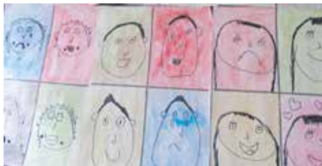
© Retrats de les nostres emocions.