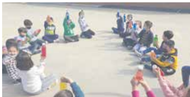
© Les ampolles de la calma ens ajuden a relaxar-nos.