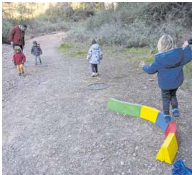
© Circuit on es treballa l'equilibri i el salt.

Cada dimecres al matí surten de l'escola i es dirigeixen cap a la muntanya, on porten a terme sessions molt variades.