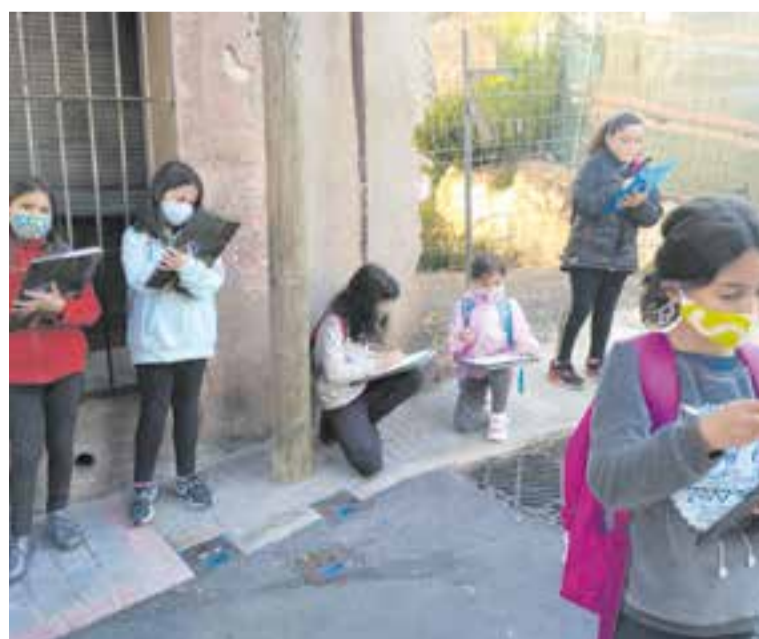
© Anotant el nom dels carrers i situant-los al mapa.