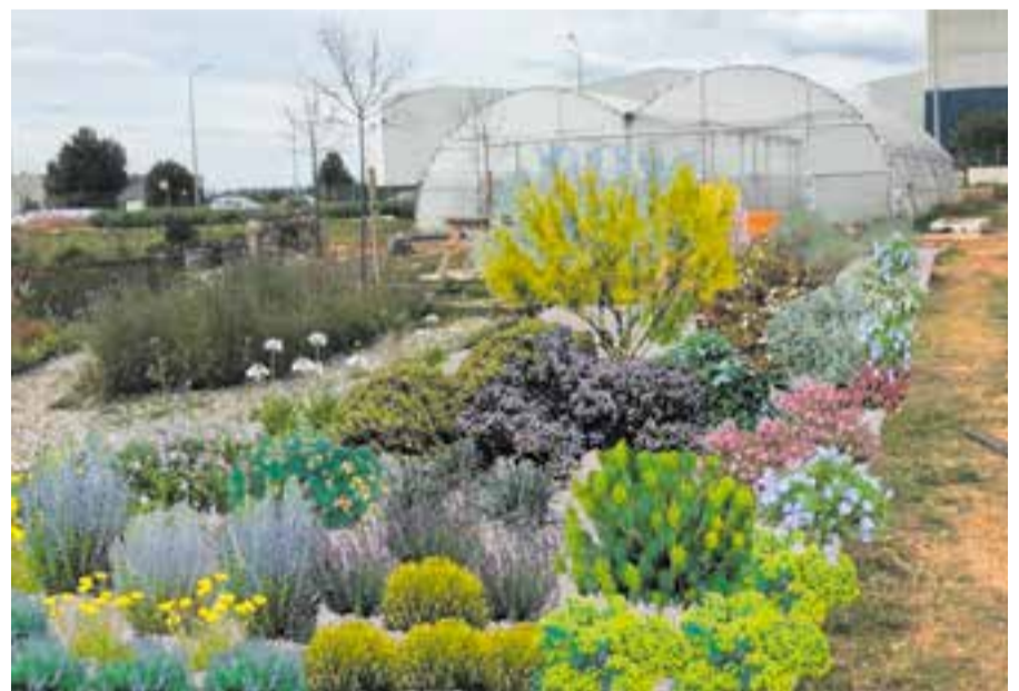
© Fotomuntatge de la proposta que es persegueix.

© Alumnat de CFGS de paisatgisme plantant (novembre del 2020).