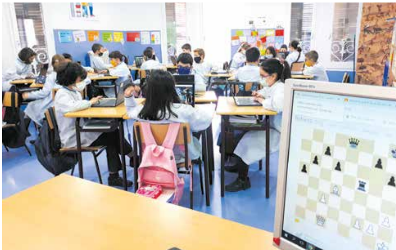
© Realitzant un exercici a classe.

Tothom hauria de provar de jugar a escacs, no importa l'edat, només tenir ganes d'aprendre un joc que segur que els agradarà.