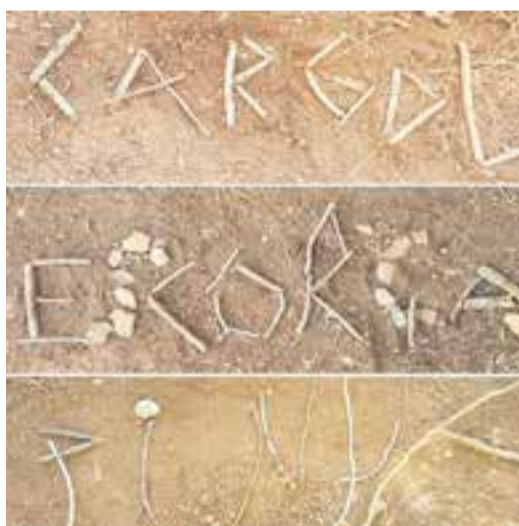
Ⓞ A través de la natura, escrivim i treballem les lletres.