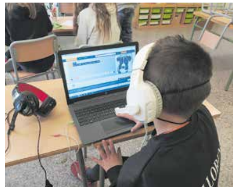
© Escoltant podcasts fets per alumnes de Polònia.