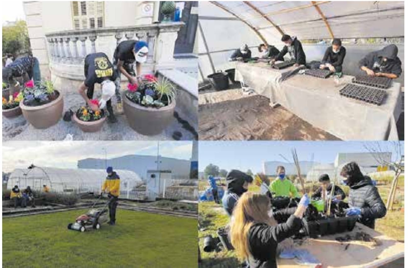
© De pràctiques per Castellar i al centre.

Unes setmanes abans ens van preparar anant a escalar a Canglomerat, al rocòdrom de Castellar del Vallès, el dia més divertit del curs. Abans de començar a escalar vam estirar el cos, després ens van explicar la diferència entre els colors de les roques, per exemple, el blanc el més senzill i el negre el més complicat, cada color tenia la seva dificultat. Acaïdes cansats però és divertit, hi havia zones difícils i per la grandària, forma i posició en la qual t'havies de col·locar per poder agafar-te i pujar. Val molt la pena.