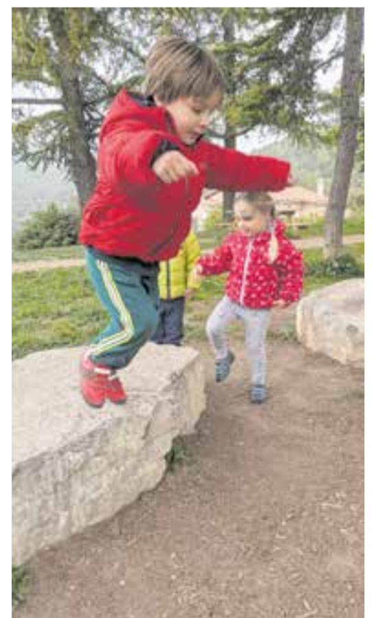
© Saltem de les pedres a terra.