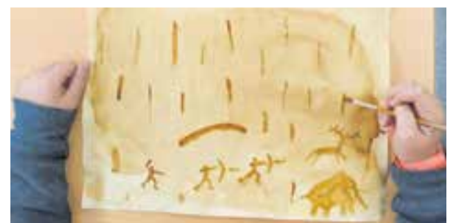
© Ja a la prehistòria, els homes i les dones expressaven les seves emocions a través de les pintures rupestres.