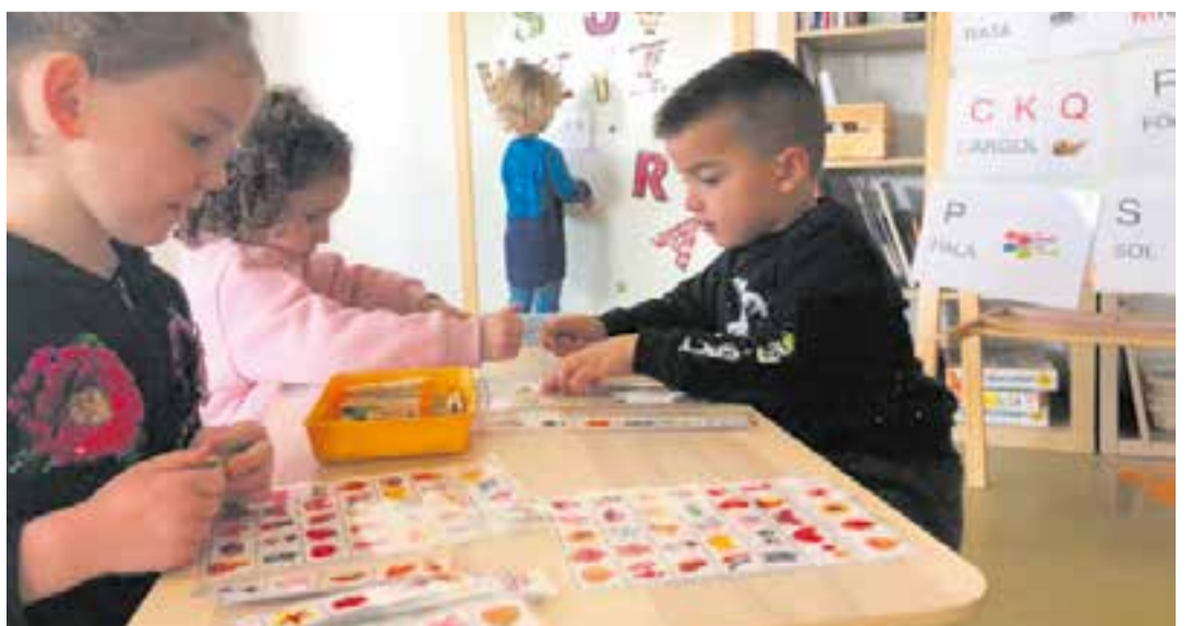
Ⓞ Fem ús de diferents recursos per treballar els diferents sons.