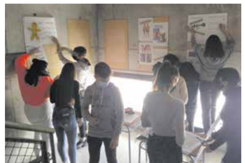
© Alumnes de 4 d'ESO treballant en el projecte.