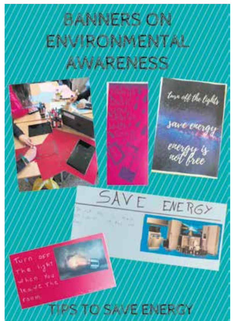
© Fem bàners per estalviar energia i els compartim amb les altres escoles.

"Ens agrada molt participar en aquests projectes perquè és emocionant."