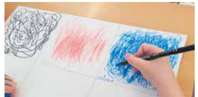
La música ens pot despertar una emoció i fer-nos viatjar amb la imaginació.