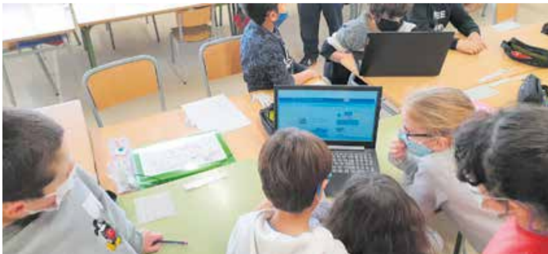
© Aprofitem els recursos tecnològics per fer les nostres històries.