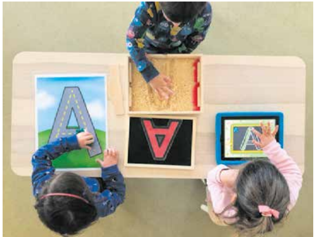
Ⓞ L'ús de les noves tecnologies és present en el procés d'aprenentatge de la lectoescriptura.

Aquesta metodologia combina diferents recursos, des de materials manipulatius senzills com sorra o serradures per fer un treball de grafomotricitat, fins a materials més complexos com "La casa de les lletres", a cicle inicial, per confeccionar paraules.