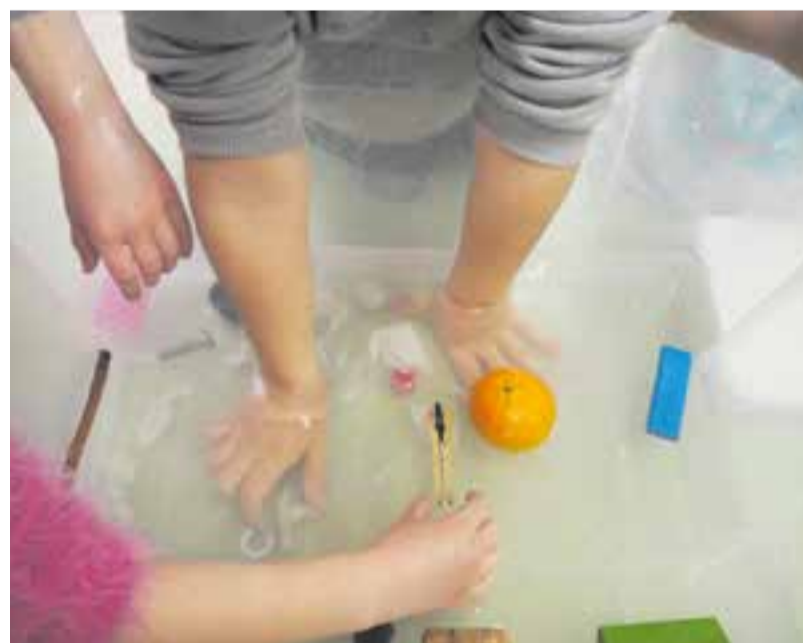
© Infants comprovant quin element sura o no sura segons les seves propietats.

Les activitats de la setmana ens han apropat a la descoberta i l'experimentació tot jugant a ser científiques i científics al voltant, sobretot, de tres eixos: l'aire, l'aigua i la llum.