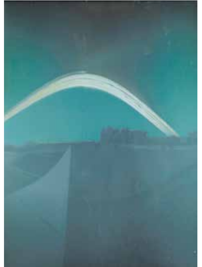
© Solarigrafia des del terrat de l'institut.

E n un món dominat per les imatges, la fotografia, tal com l'entendem habitualment, ens ha portat en moltes ocasions a la homogeneïtzació de la cultura visual. Les funcions incorporades en les aplicacions i les xarxes socials ens permeten editar i compartir imatges de forma instantània. S'ha desenvolupat una cultura del "clic, afegir filtre i publicar".