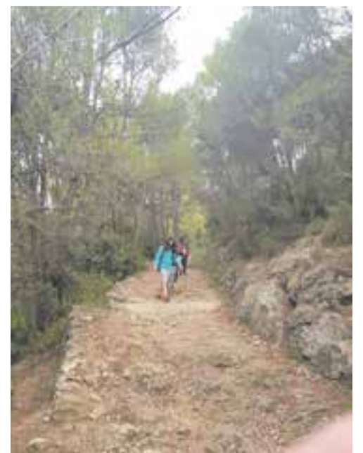
© Nens i nenes fent el camí de tornada.