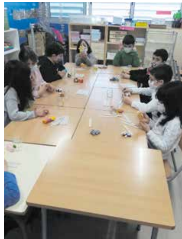
© Una manera divertida d'ordenar contes.