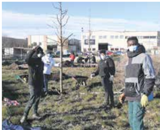
© Plantant oms a les pistes d'atletisme.