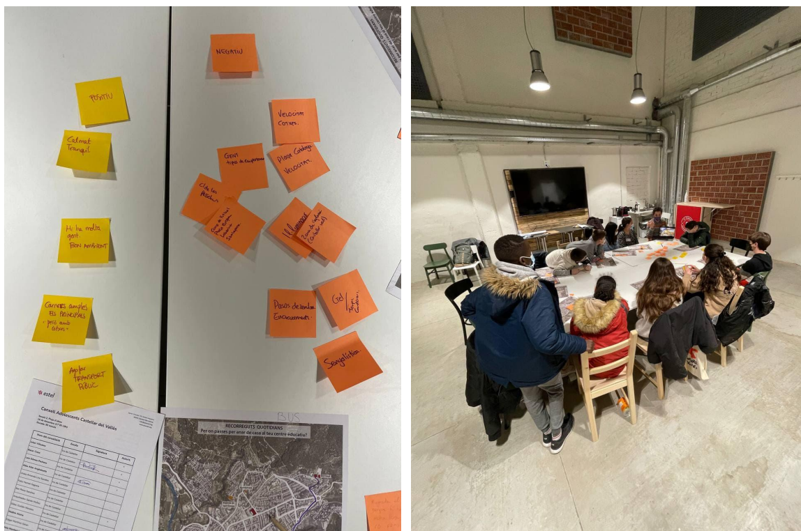
Imatge 1 | Les principals percepcions de seguretat a Castellar